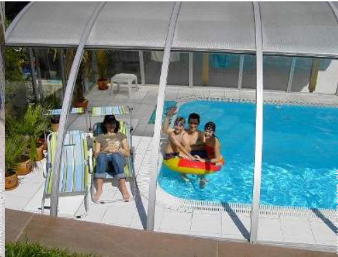
Piscina con acqua di mare