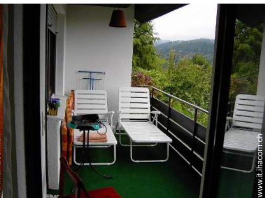
vista dalla loggia