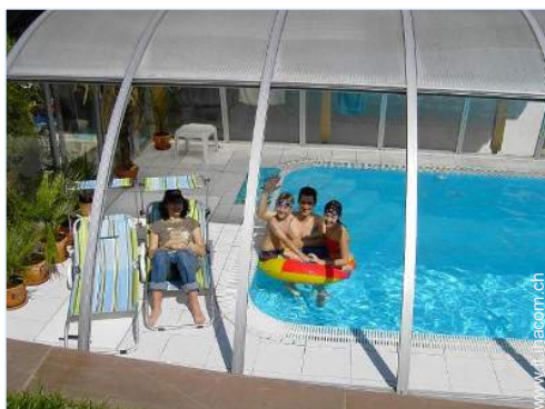
Piscina con acqua di mare