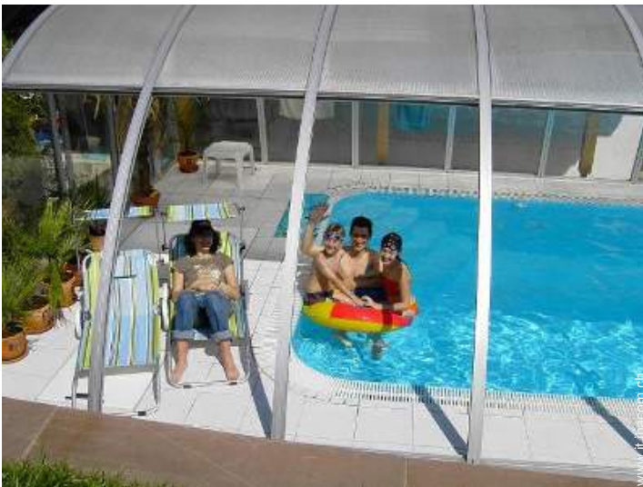
Piscina con acqua di mare