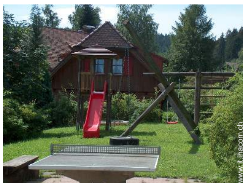
struttura rampicante per bambini