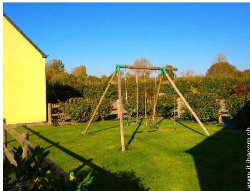
Attrezzature esterne a disposizione degli ospiti