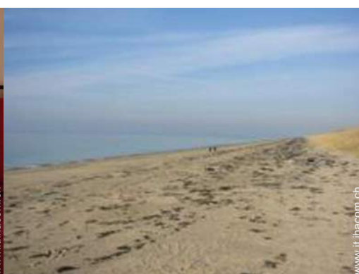
luogo per bagnarsi