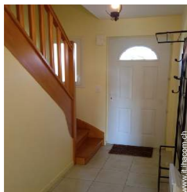
Comfort interno a disposizione degli ospiti