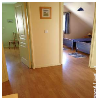
Comfort interno a disposizione degli ospiti