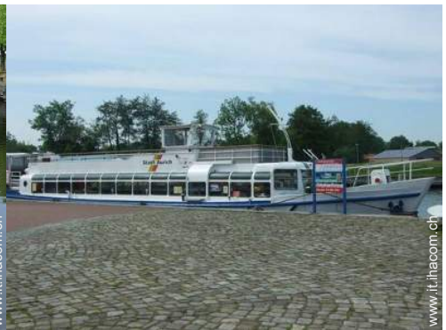
sport estivi nelle vicinanze