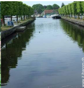
sport estivi nelle vicinanze