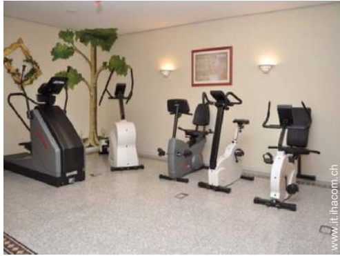
attrezzo(i) per il fitness