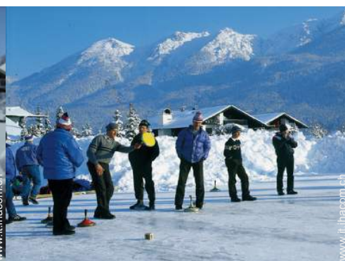
sport invernali nelle vicinanze