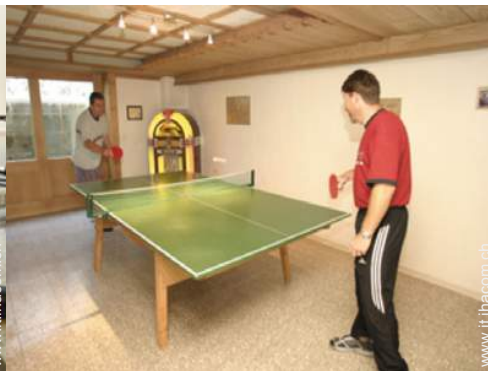
tavolo da ping-pong