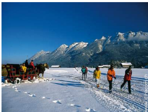
sport invernali nelle vicinanze