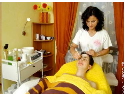
trattamenti di bellezza