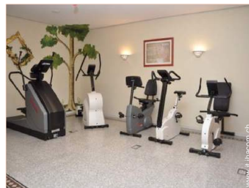
attrezzo(i) per il fitness