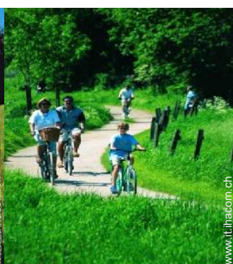
noleggio biciclette/mountain bike