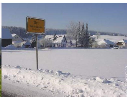
sport invernali nelle vicinanze