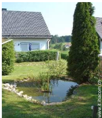
piscina fuori terra