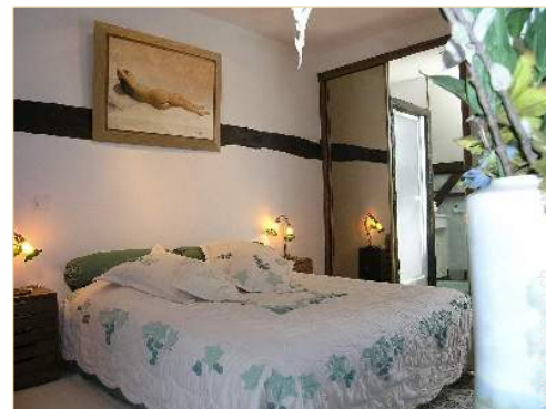
camera del proprietario

Cucina esterna, salotto estivo, bar esterno, forno per pizze, barbecue, ombrellone, salotto da giardino, 8 sedia sdraio, altalena, doccia esterna