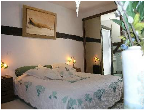
camera del proprietario