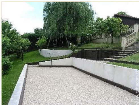
gioco delle bocce