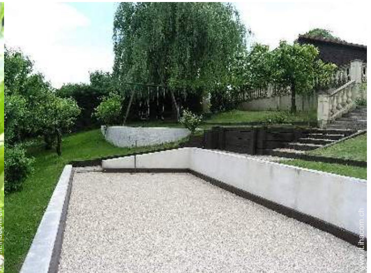
gioco delle bocce