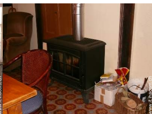
stufa a legna