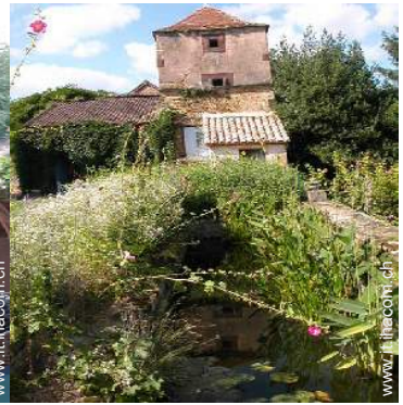
piscina fuori terra