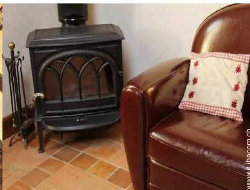
stufa a legna