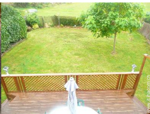
vista dal mezzanino