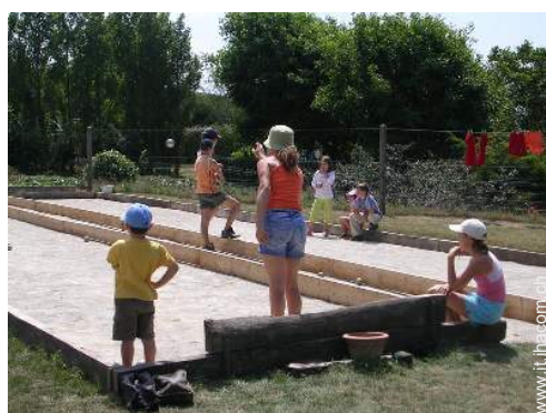
gioco delle bocce