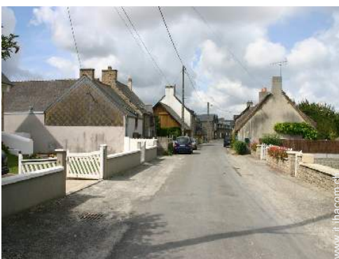
vista sulla strada/viale