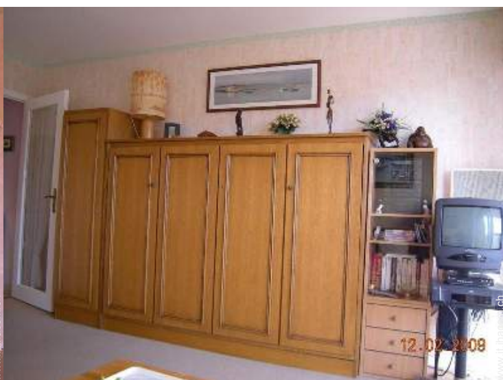
letto(i) a scomparsa 2 pers