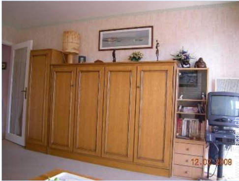
letto(i) a scomparsa 2 pers