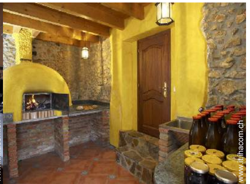
forno per pizze