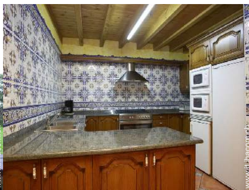
grande cucina in stile americano