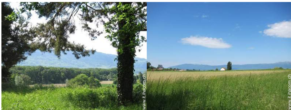
vista sulla foresta