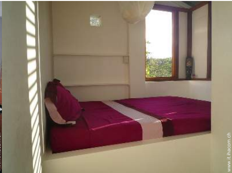
La camera degli ospiti