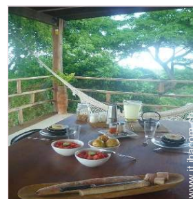
La camera degli ospiti