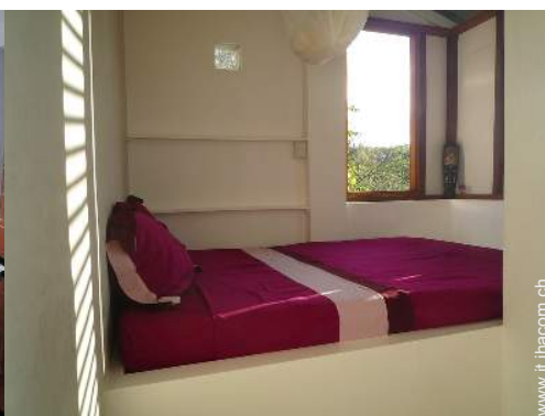
La camera degli ospiti