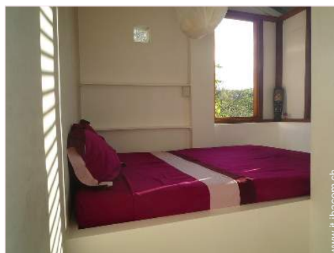
La camera degli ospiti