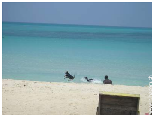
luogo per bagnarsi