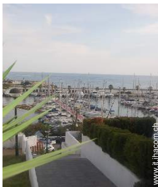
vista sul porto