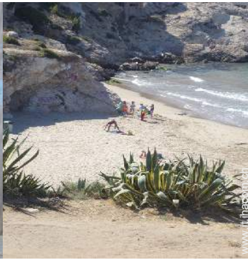
spiaggia dei nudisti