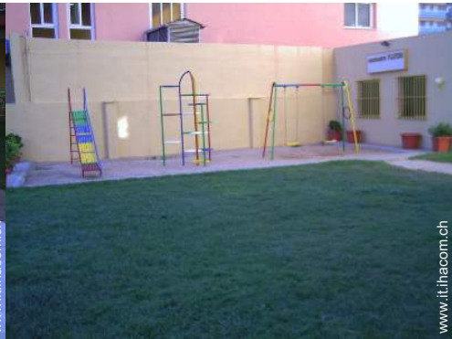
vasca per la sabbia