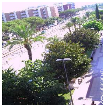
vista sulla strada/viale