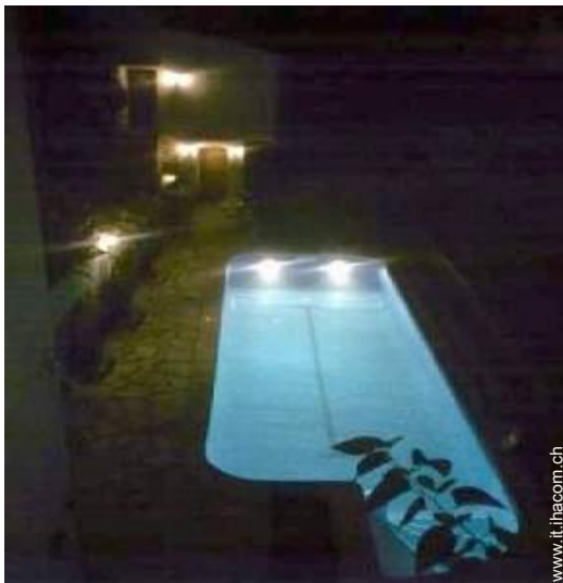
sistema di illuminazione