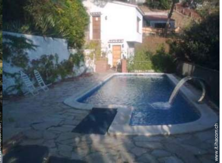
Piscina con acqua di mare