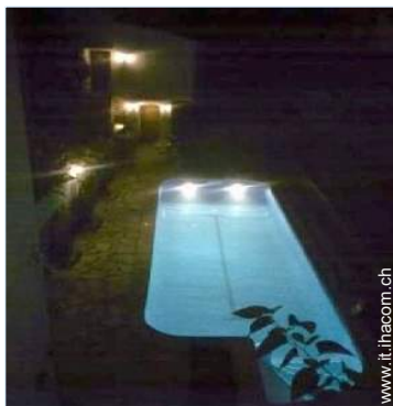
sistema di illuminazione