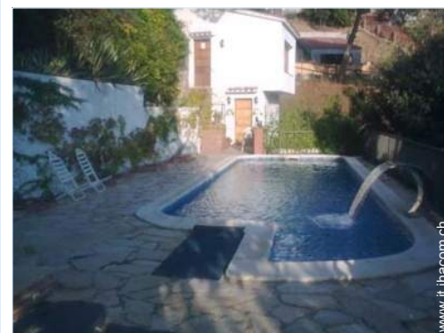
Piscina con acqua di mare