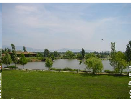
Casa di Charme