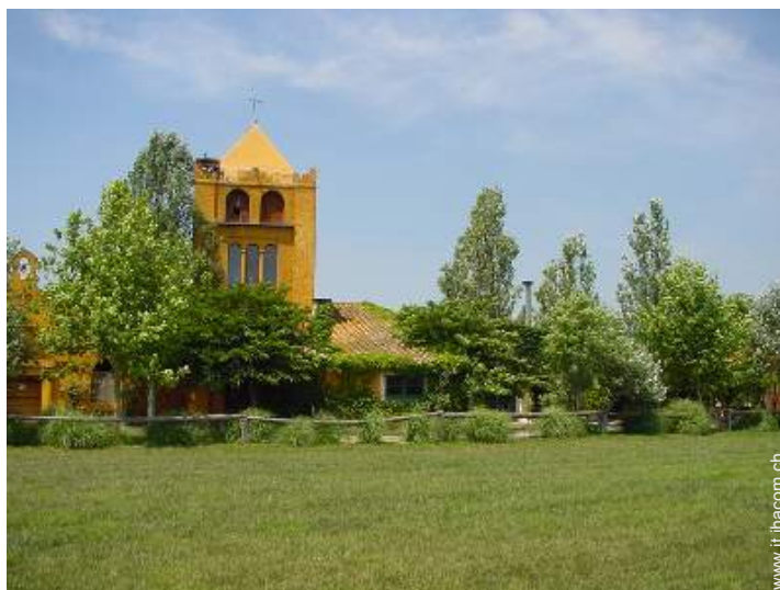
Casa di Charme