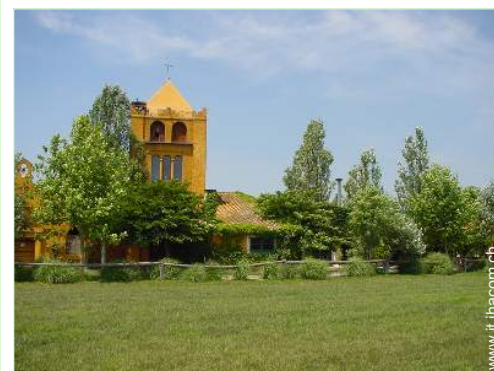
Casa di Charme