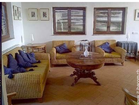
Sistemazione interna a disposizione degli ospiti