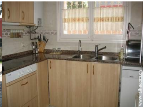
piastra di cottura elettrica