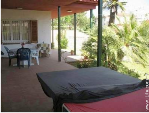
sedia(e) da giardino