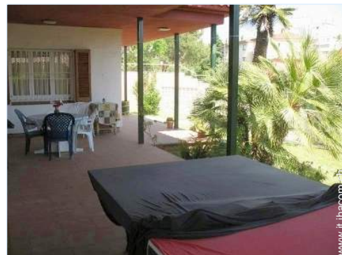
sedia(e) da giardino

Barbecue, tavolo da giardino, 7 sedia(e) da giardino, carrello, ombrellone, salotto da giardino, 4 sedia sdraio, doccia esterna