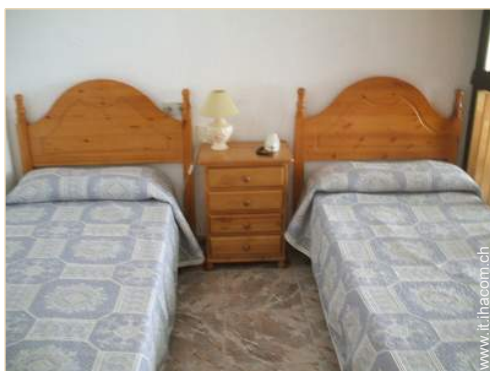
letti gemelli singoli