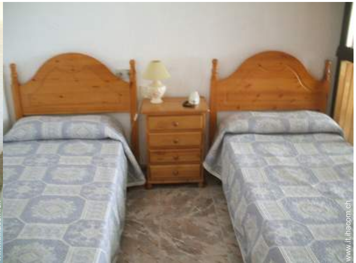
letti gemelli singoli