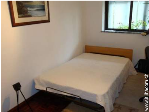
letto(i) a scomparsa 2 pers