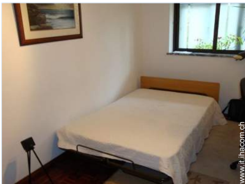
letto(i) a scomparsa 2 pers