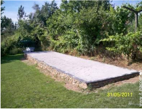
gioco delle bocce