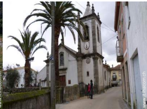
vista sul centro del paese