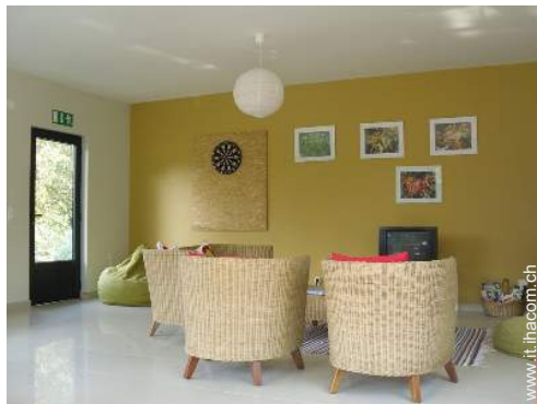
gioco delle freccette