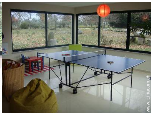
tavolo da ping-pong