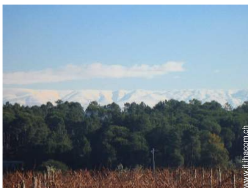
piste di sci