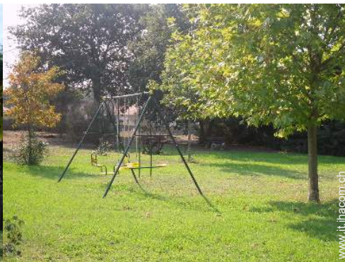
struttura rampicante per bambini