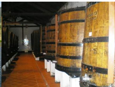
cantina e degustazione di vino