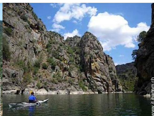
barca a remi