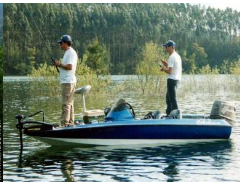
pesca con lenza