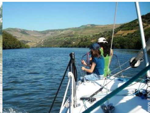
escursione in barca