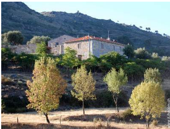
Casa di Campagna