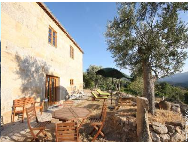
Ambito esterno a disposizione degli ospiti