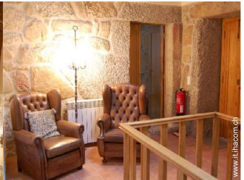
Comfort interno a disposizione degli ospiti