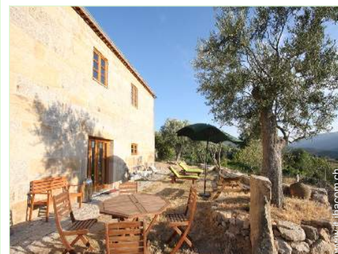
Ambito esterno a disposizione degli ospiti