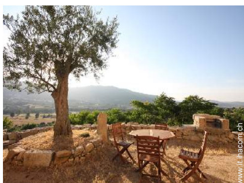
Ambito esterno a disposizione degli ospiti