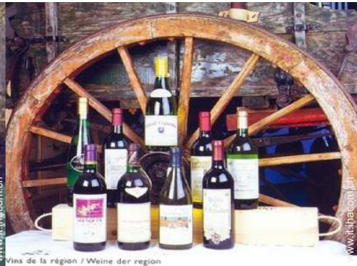
Vins de la région / Weine der region