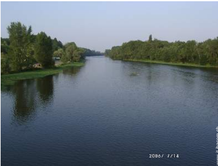
pesca con lenza