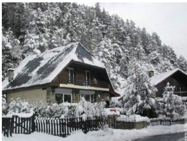
Chalet di Montagna