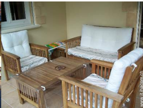
Installazione esterna a disposizione degli ospiti