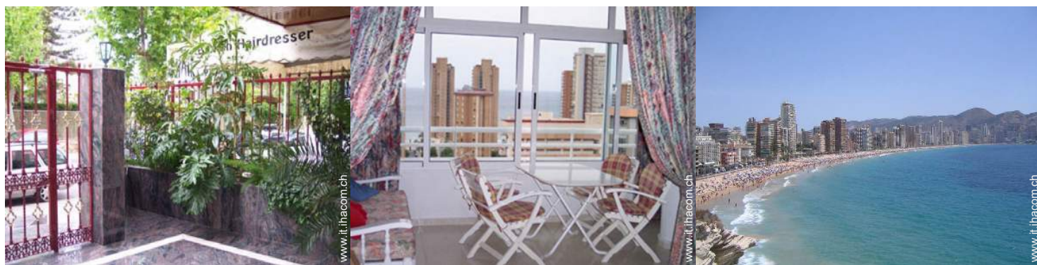
Attrezzature a disposizione