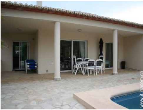
sedia(e) da giardino