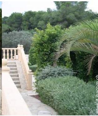
Accoglienza persone diversamente abili