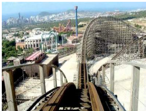
parco dei divertimenti