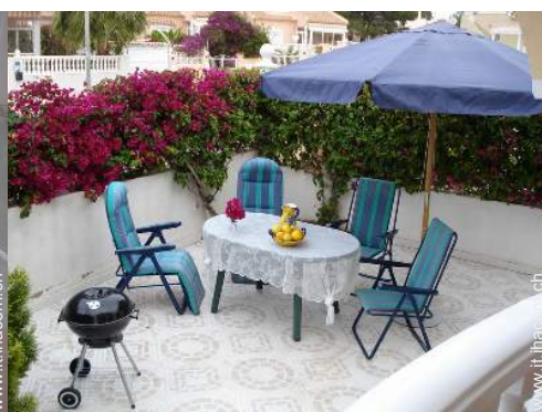
salotto da giardino