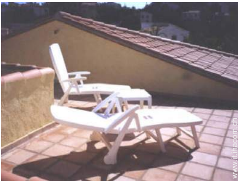
vista dalla terrazza sul tetto