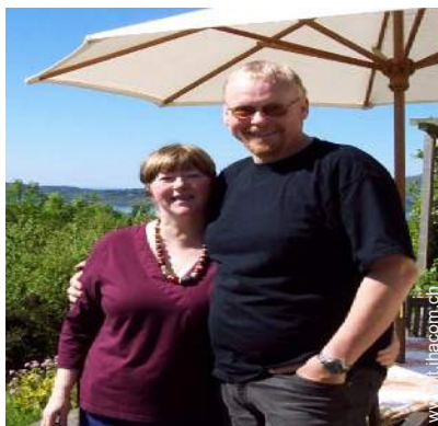
I vostri ospiti