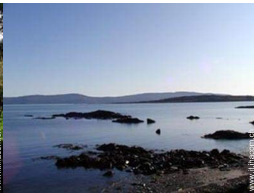
spiaggia con ciotoli