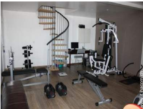
attrezzo(i) per il fitness