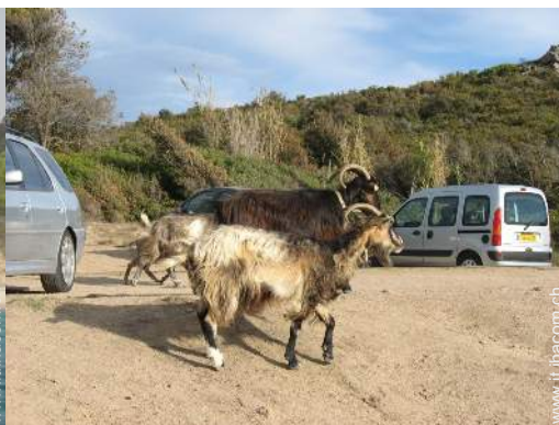
Presenza sul posto