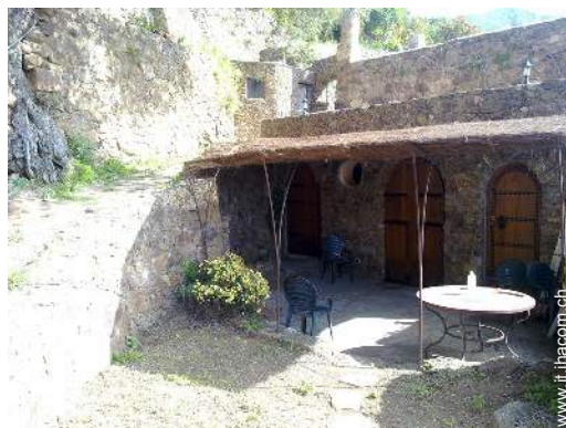
Casa in Pietra