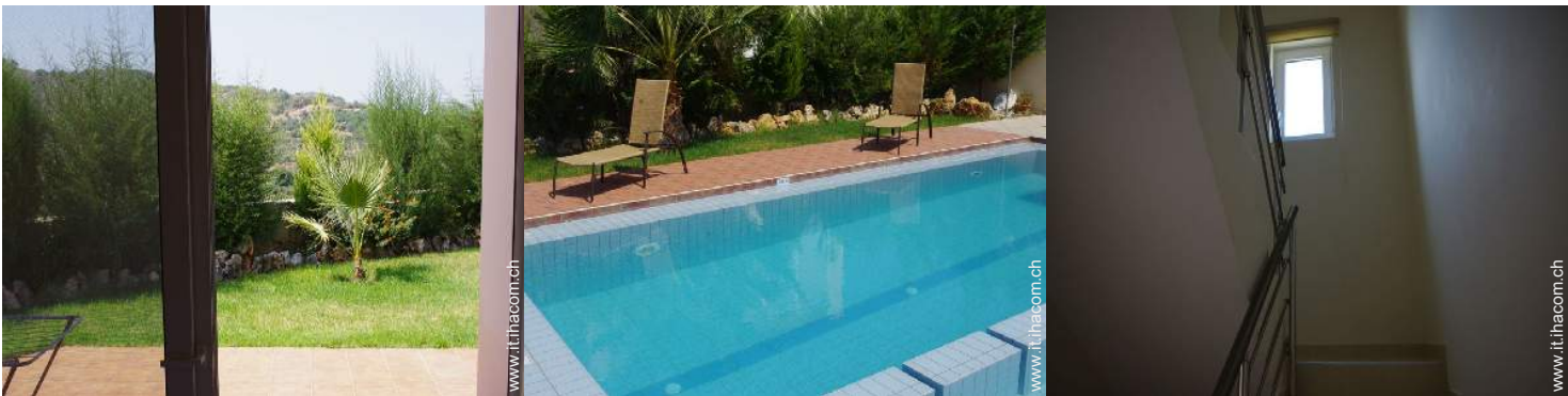
vista dalla veranda