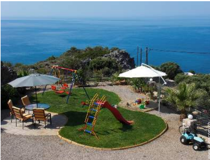
struttura rampicante per bambini