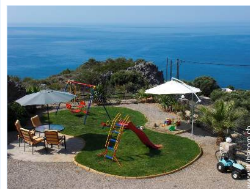
struttura rampicante per bambini