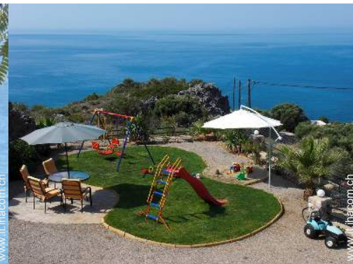
struttura rampicante per bambini