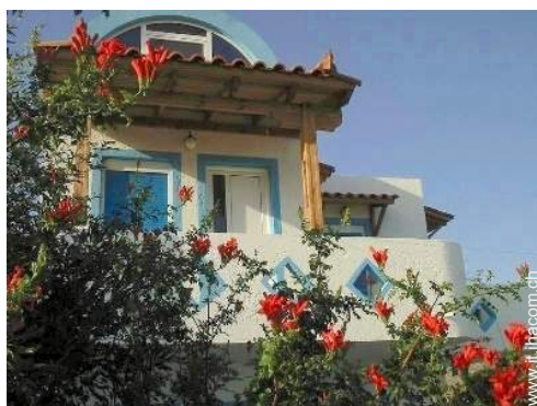
Appartamento di Charme