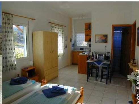
Appartamento di Charme