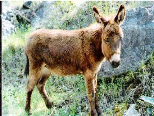
Gli animali domestici