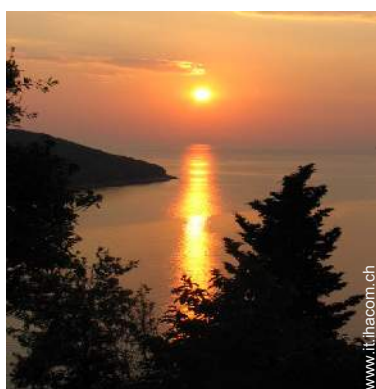
vista sul tramonto