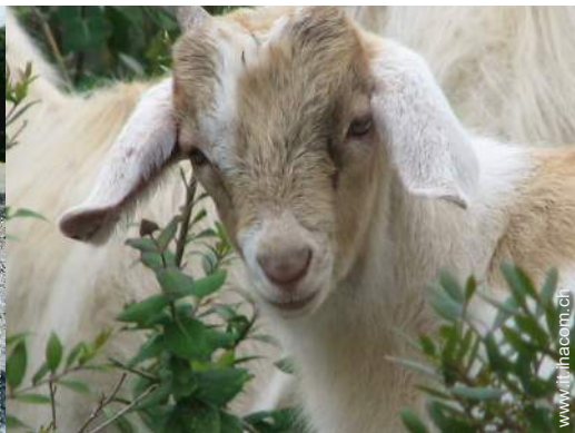
Gli animali domestici