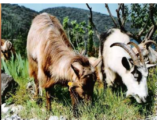
Gli animali domestici