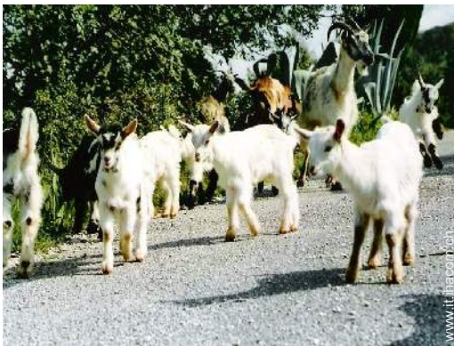
Gli animali domestici