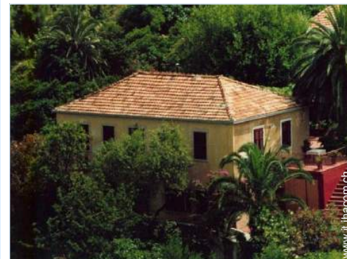
Casa di Villaggio