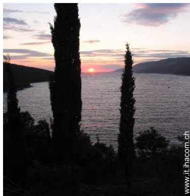
vista sul tramonto