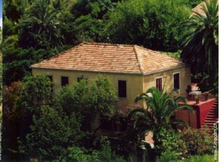
Casa di Villaggio