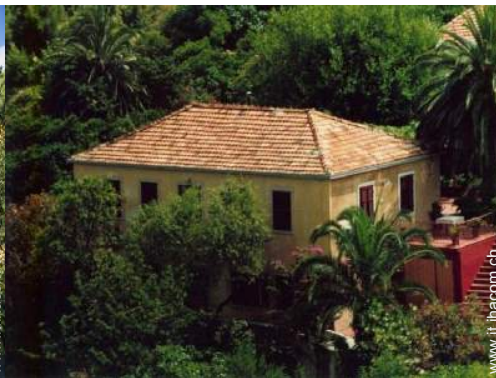
Casa di Villaggio