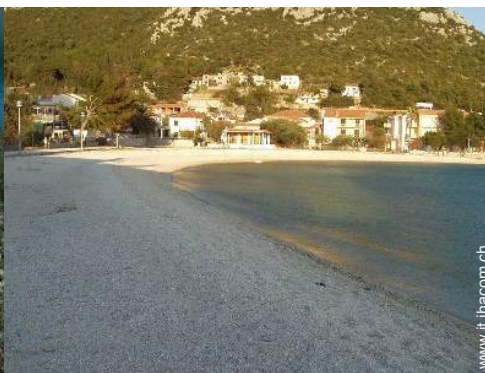
spiaggia con ciotoli