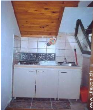
utensili e batteria da cucina