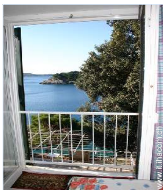
vista dalla veranda

Privilegi : Accesso diretto alla spiaggia, spiaggia privata