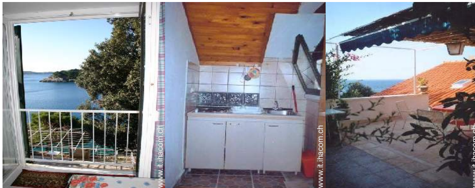
vista dalla veranda