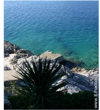
accesso diretto alla spiaggia