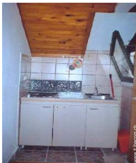
utensili e batteria da cucina